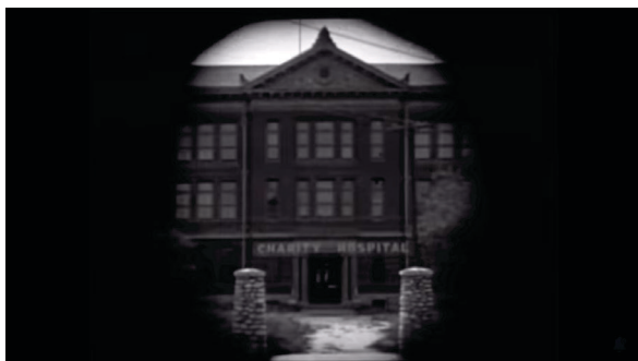
Фиг.2 Кадър от филма „Хлапето“ (The Kid, 1921)

преходите между отделните сцени е бленда, която постепенно се отваря при започване на нова сцена или се затваря, за да се отбележи края на дадено събитие. „Хлапето“ е един от първите филми, който прави опит за комбиниране на комедия и драма.