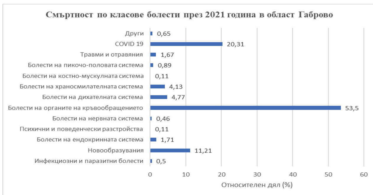
Фиг. 4. Относителен дял на общата смъртност по класове болести в област Габрово през 2021 година

Таблица 9 и фигура 5 отразяват смъртността от социално-значими заболявания в област Габрово през 2021 год. Доказва се отново водещото място на болестите на ор-