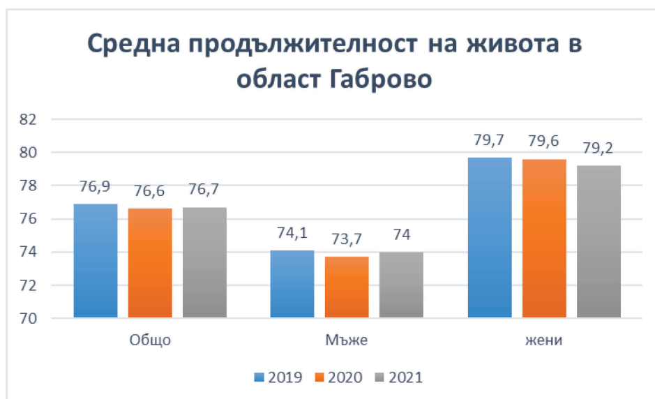
Фиг. 1. Средна продължителност на живота в област Габрово 2019 – 2021 година