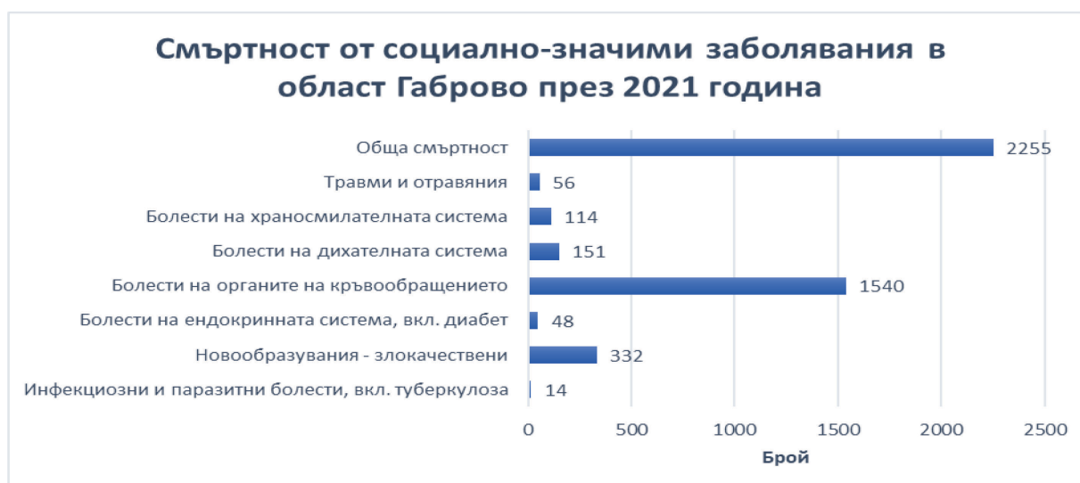
Фиг. 5. Смъртност от социално-значими заболявания в област Габрово през 2021 година